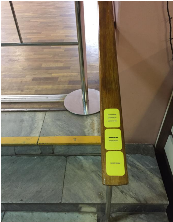
Рис. 7. На периллах входной группы расположены предупредительные тактильные наклейки.