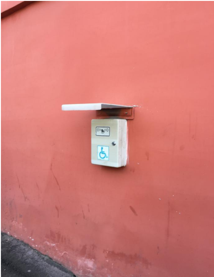
Рис.1. Установлена кнопка вызова охранника обратной связью и с обозначениями пиктограммой.