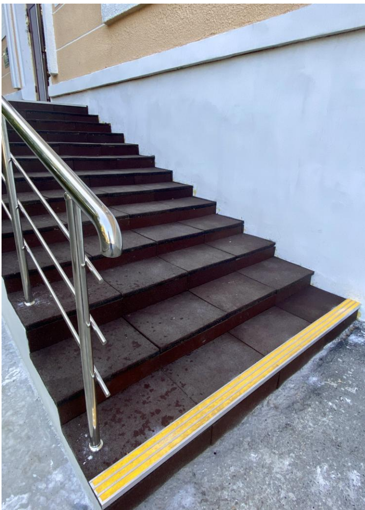
Рис.2. На лестнице нанесены предупредительные полосы.