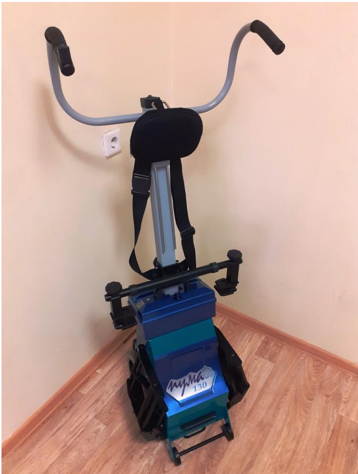
Рис. 4. Имеется подъемник, предназначенный для социальной доступности инвалидов и лиц с ОВЗ.