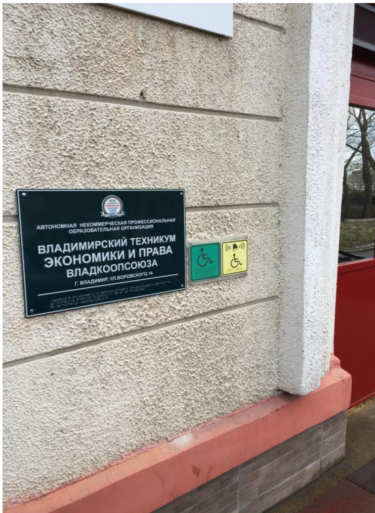
Рис. 5. Установлено информационное табло, дублированное шрифтом Брайля.