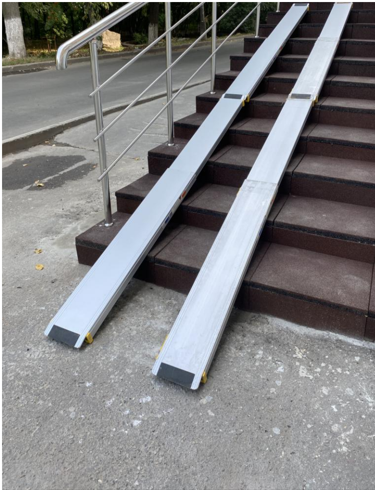
Рис.3. Установлены переносные пандусы.