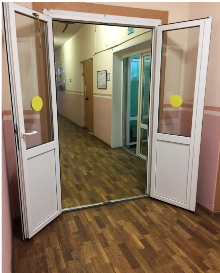
Рис. 8. Обеспечены проходы (проезды) для инвалидов и лиц с ОВЗ с нанесением на стеклянных панелях контрастной маркировки (желтым цветом).