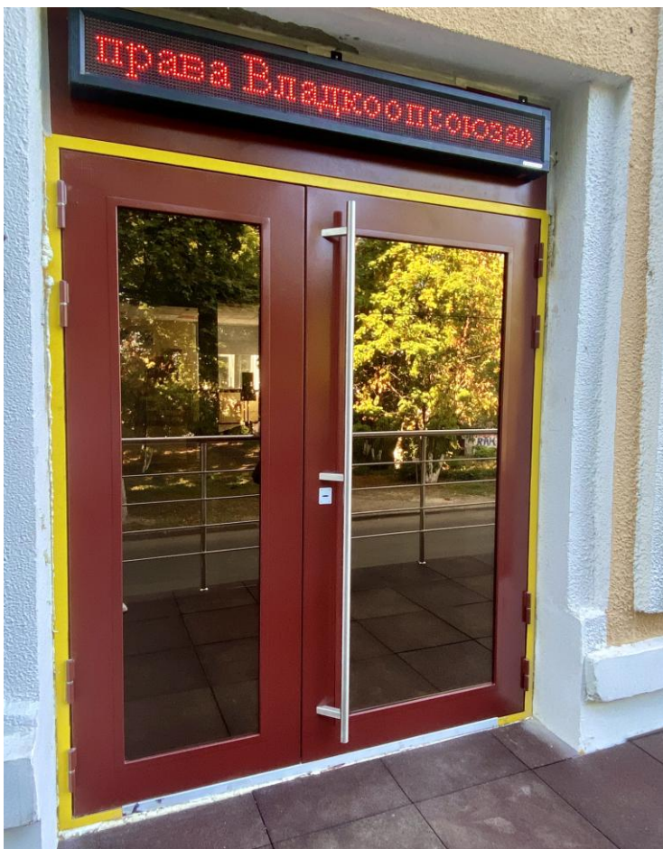
Рис.6. На входной двери нанесена контрастная разметка.