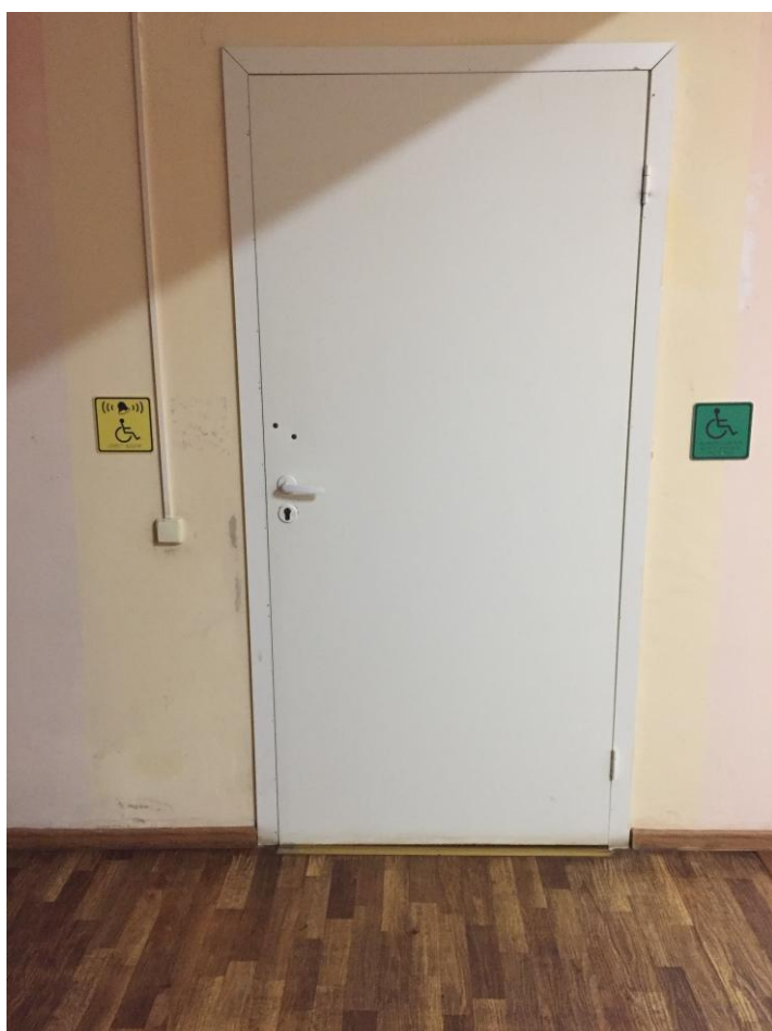
Рис. 6. Имеется санитарная комната предназначенная для инвалидов и лиц с ОВЗ.