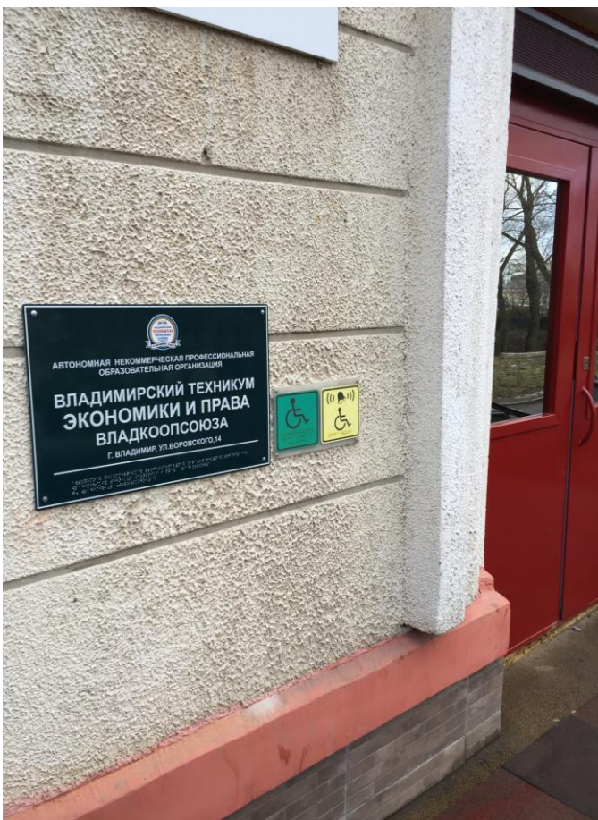
Рис. 2. Установлено информационное табло, дублированное шрифтом Брайля.