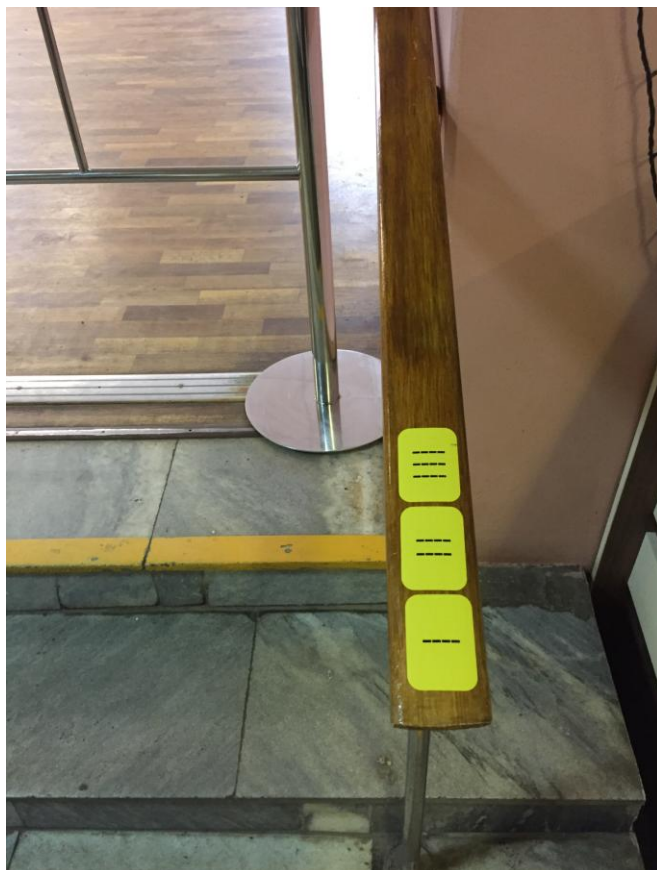
Рис. 3. На периллах входной группы расположены предупредительные тактильные наклейки