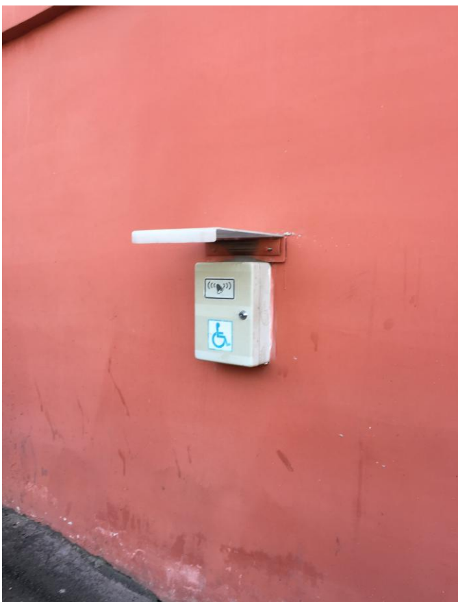
Рис. 1. Установлена кнопка вызова охранника обратной связью и с обозначениями пиктограммой.